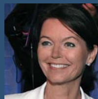
Lise Kingo. CEO y directora ejecutiva UN Global Compact

“ Hoy, el Pacto Mundial de las Naciones Unidas hace un llamamiento especial para dar una respuesta corporativa a la pandemia. Para que todas las empresas tomen medidas colectivas para frenar el brote de COVID-19 y se mantengan unidas para facilitar la continuidad de los negocios con el fin de una rápida recuperación.